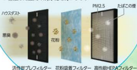
「三重構造空気清浄フィルター」

業界最高クラス集塵効率(99.97%)の高性能HEPAフィルターを採用した、「三重構造空気清浄フィルター」でPM2.5はじめハウスダスト、タバコの煙、悪臭などの集塵、脱臭を行い徹底した空気の清浄化を行います。